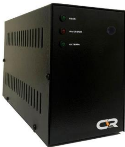
Imagem 2. Captura de tela do catálogo apresentado pela recorrida.

A inobservância deste prazo de garantia, que é um requisito mínimo do Termo de Referência, impõe a desclassificação da proposta, por apresentar uma condição que onera o erário e desprotege a Administração em um período significativo após a entrega do equipamento, ferindo o objetivo de contratação mais vantajosa e segura.