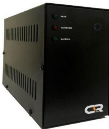
Imagem 2. Captura de tela do catálogo apresentado pela recorrida.

Alarme de indicação potência excessiva na saída do no break • Garantia 12 meses